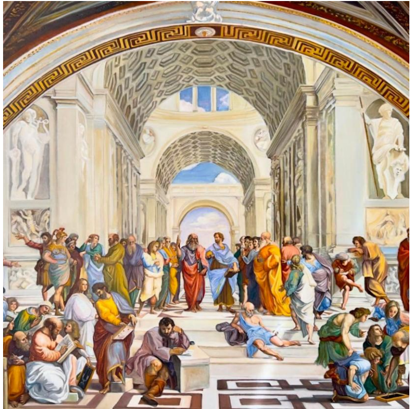
Platon und Aristoteles